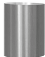
5 Tubo reflectivo extensión