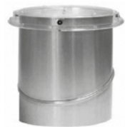
4 Tubo reflectivo superior