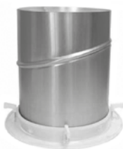
6 Tubo reflectivo inferior